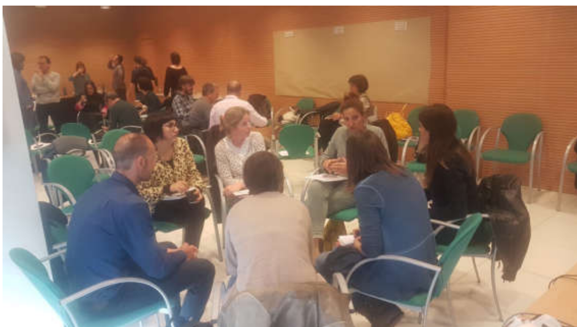
Foto del treball en grups.

Cada grup ha treballat les tres preguntes i ha anotat idees i propostes en post-its que després s'han explicat en la posada en comú dels quatre grups.